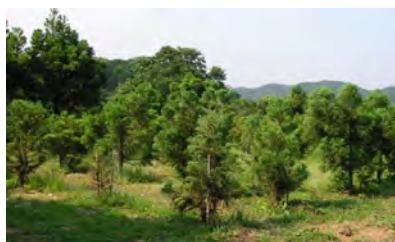
写真1 花粉の少ないスギ採種園 (自然環境保全センター所内)

花粉を出す雄花の量は、個体によって異なるため、雄花量の少ない個体を選抜することは花粉量の少ない苗木の生産につながります。そこで1998年に花粉の少ないスギを選抜し、当センターの敷地に種子を生