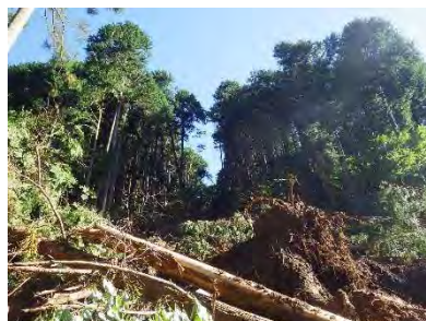
斜面上の林地崩壊