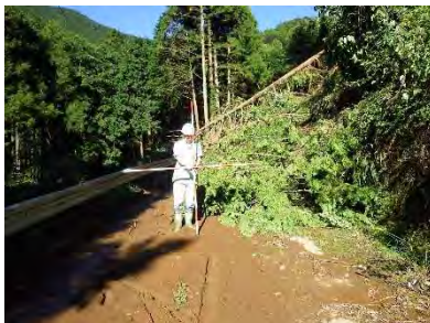
秦野市蓑毛（浅間山林道）