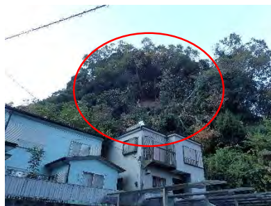
横須賀市田浦大作町

林地、治山施設で併せて 30 箇所の被害があり、横須賀市田浦大作町では、住宅の裏の斜面が崩壊しました。