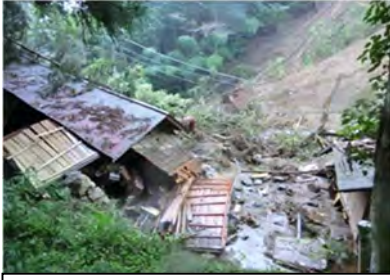
相模原市緑区小原（坂沢林道）