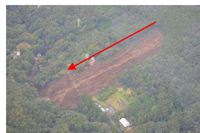
相模原市緑区牧野（新和田沢）林地崩壊

森林の被害は、林地 114 箇所、林道施設 237 箇所、治山施設 13 箇所と県内で最も被害が多く、このうち相模原市緑区牧野では、林地崩壊により民家 4 戸が全壊し、死者 3 名、重傷者 1 名の甚大な被害が発生しました。