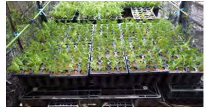
写真5 生産を開始した「神奈川 無花粉ヒ1号」(横浜市戸塚区)

め種子による生産ができない ことから、さし木による生産を 開始したところです(写真5)。