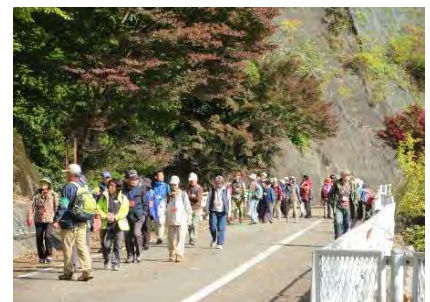
林道ウォークの様子

治山・林道の役割、森林整備の必要性について初めて知る方が多く、紅葉し始めた山々の景色を見ながら、講師の話を熱心に聞いておりました。