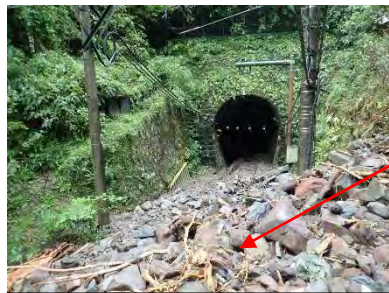
箱根町大平台（箱根登山鉄道）

総雨量が1,000mmを超えた箱根町の箱根登山鉄道沿線では、10か所以上で土砂崩れが発生し、線路が埋まったほか、橋が流出しており、現在も不通となっています。