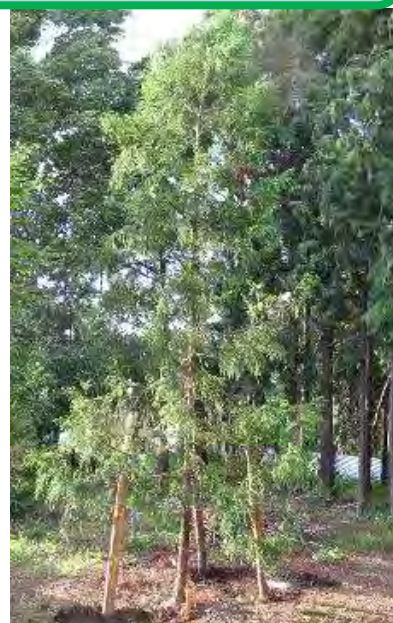
写真3 無花粉スギ「田原1号」 (神奈川不稔1号 保全セ所内)

花粉を全く出さない無花粉スギは、1992年に富山県で発見され、その後の調査で5000本に1本程度の割合で存在すると推定されました。そこで神奈川県で生産していた花粉の少ないスギ888本を調査したところ、1本の無花粉スギが発見されました。その後の調査でこの無花