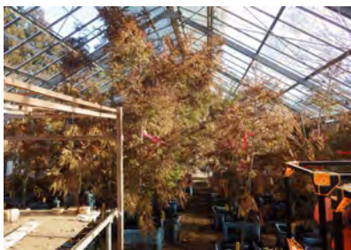
写真4 無花粉スギ閉鎖系採種園 (自然環境保全センター所内)

木生産者に配布し、苗木生産を開始しました。ただし、メンデルの法則に則った劣性遺伝のため、無花粉スギと花粉を出すスギが1:1で生じることから、無花粉スギと分ける技術が必要になります。スギの苗木は2年間で育苗することから、ジベレリンという植物ホルモンをかけて苗木に雄花をつけさせ、雄花を採取し袋内でペンチで潰し、花粉の有無を判定する手法を開発しました。これにより2010年に初めて683本の苗木を生産し、全量を全国植樹祭に供給しました。以降、生産を拡大して、2018年には、約8,000本の苗木が生産されています。