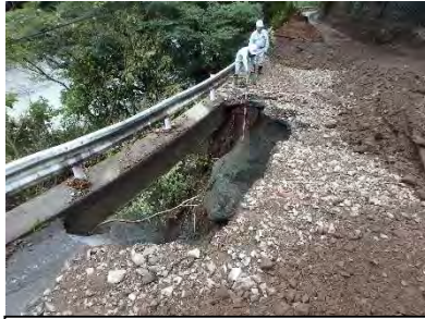
相模原市緑区青根（神の川林道）