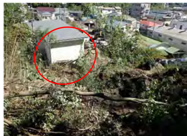
山北町川西地内町有施設の損壊

また、山北町では、山北町役場清水支所の裏の斜面が崩壊し、治山施設が損壊するとともに、町施設の一部が被害を受けました。