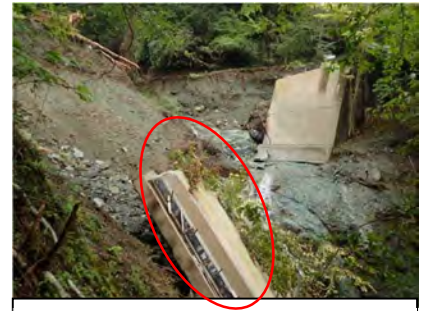
山北町玄倉（秦野峠林道）

山北町玄倉では、斜面崩壊により林道の橋桁が落ちたほか、28箇所被害が発生したため、大掛かりな復旧対策が必要となっています。