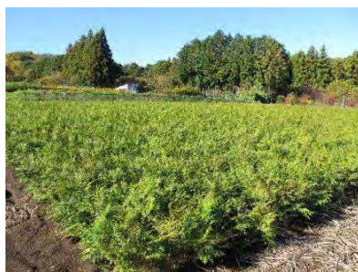
写真2 花粉の少ないヒノキ苗の生産(南足柄市)

産する採種園を造成し、普及を図ってきました(写真1)。花粉症対策品種の採種園は全国で初めてのもので、ヒノキも同様に採種園を造成し、2014年春の出荷苗木からは、スギ・ヒノキともに全てを花粉症対策品種に転換しました。関東地方を中心にスギの苗木の転換が進んでいますが、スギ・ヒノキともに花粉症対策品種に転換したのは、神奈川県が唯一であり、先進的に取り組みを進めています(写真2)。