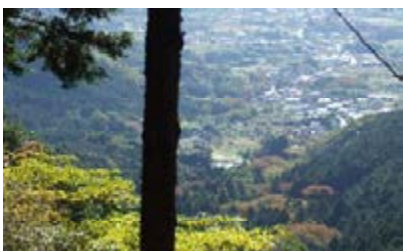
水源林下流の蓑毛の集落

小田急線が昭和2年(1927)に開通すると、伊勢原からの参詣客が増え、蓑毛からの参詣客が激