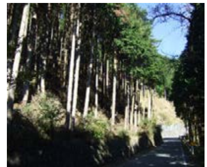
道沿いに続く植林地

しかし昨今、この立派な木を売っても、所有者の手にする金額は再造林さえままならないわずかな金額であると聞くと、無念という言葉を超えて憤りさえ感じられる。