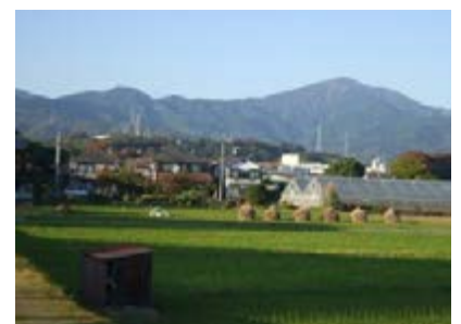
大山と春嶽水源林を望む