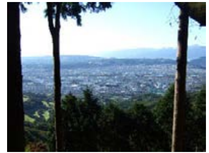
秦野盆地と秦野市街

盆地の深層部には、丹沢山地から流れ込む地下水が蓄えられ、その量は芦ノ湖の1.5倍の3億トンといわれ、湧水が市内の各所に湧出している。この豊富な地下水は、秦野市水道の約70%を賄う。