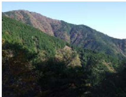
大山と春嶽水源林