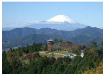
菜の花台園地と富士山

眼下には秦野盆地いっぱい広がる秦野市街。そして、その先には相模湾に浮かぶ江ノ島から伊豆半島までが一望のもとに見渡せる。