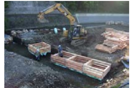
木工沈床の河川工事

元気にすることが出来るということで、治山や林道の工事だけでなく他部局の工事でも、できる限り使用するように努めているとのことである。