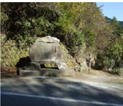
記念碑と柏木林道入口

昨今、森林の持つ水源涵養や山地保全機能が注目されているが、はるか昔から、数々の悲惨な経験を通して治山、治水のためには何をすべきかを理解し、実践した人々の思いが伝わってくる。