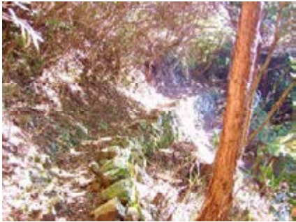
当時の石積が残る柏木林道

現在、道幅は開設当時の半分ほどになっているが、岩を穿ち、石を積み上げた箇所が所々に残っている。よくぞやったと感心するとともに、その熱意が伝わってくる。